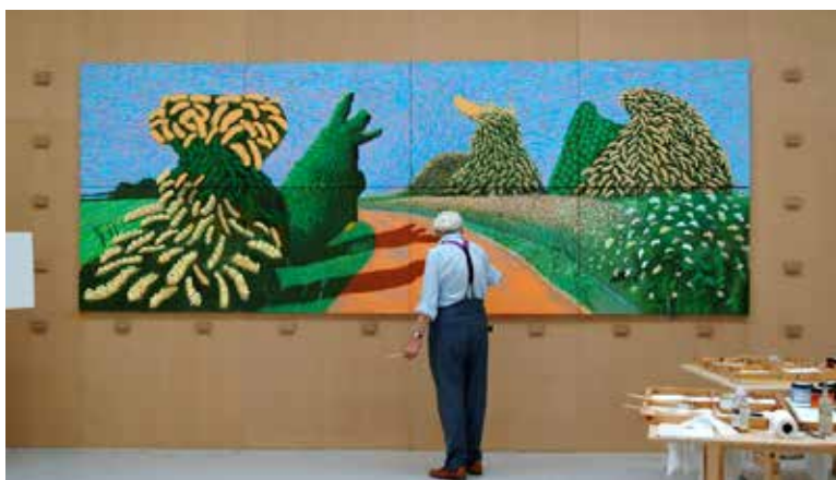
David Hockney schildert 'Bloeiende meidoorns langs de Romeinse weg', 2009

De laatste museumlezing van dit seizoen staat in het teken van de lente. De Engelse kunstenaar David Hockney is namelijk dol op de lente en dat zullen we weten ook. Want in het Van Gogh Museum is t/m 26 mei de dubbeltentoonstelling te zien van David Hockney en Vincent van Gogh.