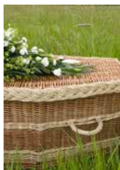
Een natuurvriendelijke mand kan een alternatief zijn

We worden ons steeds meer bewust van de gevolgen van onze leefstijl voor het milieu. En die gevolgen zijn er niet alleen tijdens ons leven, maar ook na