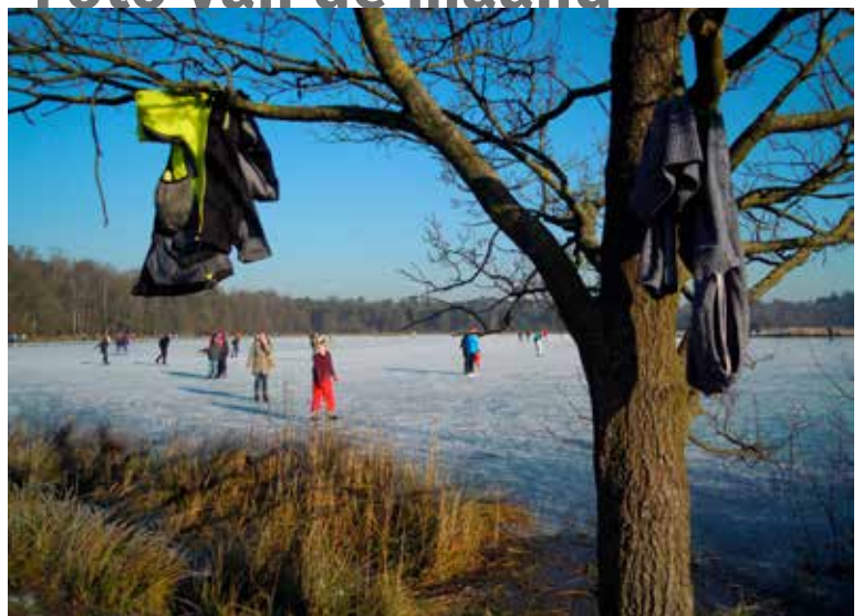
Thema 'Winter en water'