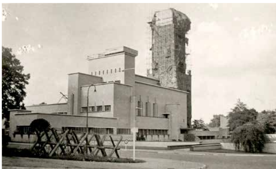
De toren van het raadhuis: tijdens de oorlog gecamoufleerd door de Duitsers.

In Hilversum werd het hoofdkwartier gevestigd van de 'Wehrmachtbefehlshaber', generaal Christiansen. Het raadhuis werd geconfisqueerd en gecamoufleerd. De Wehrmacht maakte de wijk Trompenberg tot 'Sperrgebiet' en bouwde er de grootste bunker van de Atlantikwall. Van daaruit reed de Duitse generaal Blaskowitz in mei 1945