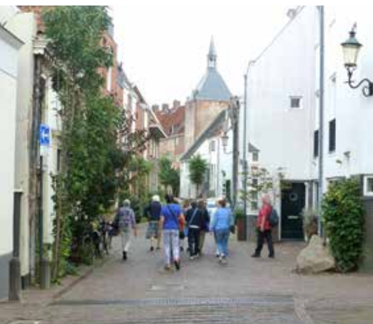
Een eerdere stadswandeling

Senver organiseert stadswandelingen in het zomerseizoen, van april tot en met oktober, op de 3e donderdag van de maand. Vanwege de zomerschool niet in juli en augustus. In dit artikel de algemene informatie over de stadswandelingen.